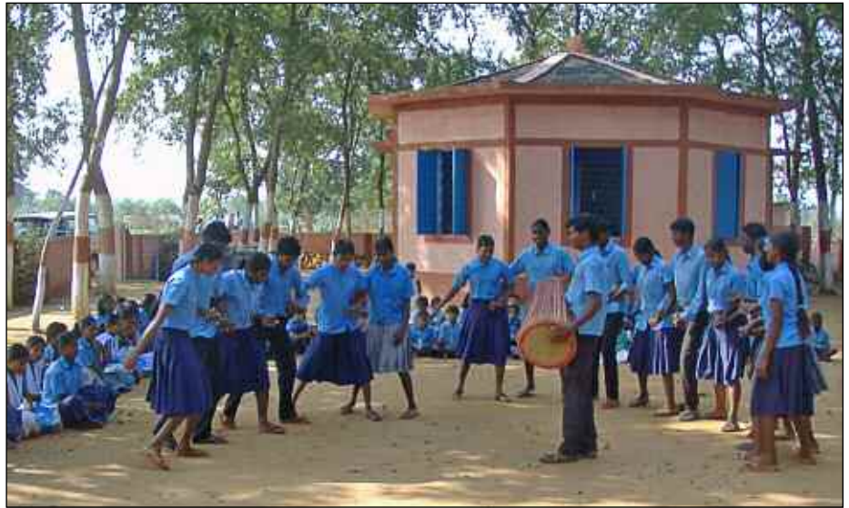
Skolbarn i Nindra underhåller med dans till trumma. Två grupper dansar mot varandra med mycket konstfulla steg. Till vintern får de strumpor och skor.