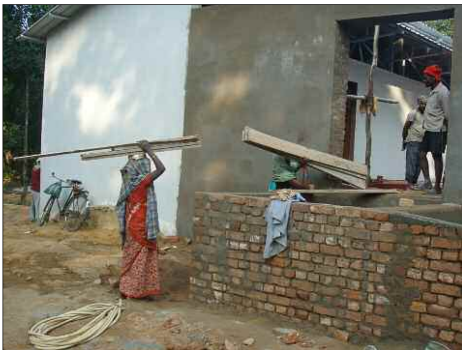
Grovarbetet vid sjukhusbygget utförs av kvinnor.

nar hon det kommande året med rikedom och välgång.