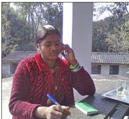
Pútl Dési: »Hallo? Javisst, jag kommer. Jag har bara en liten intervju här.«