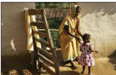
Krukmakarens hustru och barn i byn Domaro.