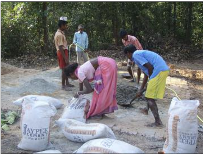
Arbetare vid sjukhusbygget. Allt jobb sker för hand.

Under tidigare år besöktes Jagriti Vihara av en grupp indiska medicinstuderande från Stanford-universitetet i Kalifornien. En av dem ville bidra till hälsan i byarna genom att finansiera ett litet sjukhus i Jagriti Viharacentret. Behovet av sjukvård är enormt och odiskutabelt.